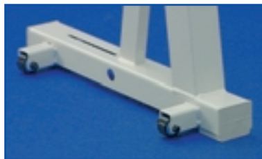
Am rechten Gestellfuß außen angebrachte Rollen mit Fadenschutz, Version "ROA"