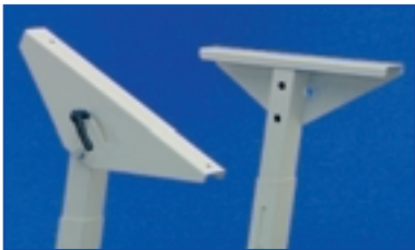
Tischplattenauflage neigbar Version "VT".