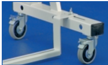
Rollenausführung "R075" mit nach unten versetztem Tretplattensteg. Rollen fadengeschützt und total feststellbar.